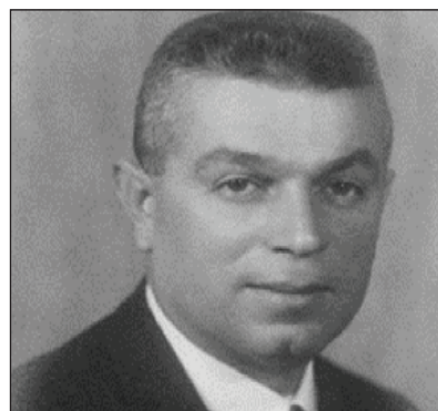
Şekil 1. Dr. Behçet Uz. 1

Sözünü ettiğimiz hekimlerden biri olan Dr. Behçet Uz, 16 Ocak 1893'te Buldan'da doğmuştur (Şekil 1). Yaşamında oldukça önemli bir yeri olan babası Müftü Salih Efendi, annesi Ayşe Hanım'dır. Çocukluk yılları doğduğu beldede geçmiş, ilk ve orta öğrenimini Buldan'da tamamlamıştır. Parasız-yatılı öğrenci olarak İzmir İdadisi'nde okuduğu 1905-1910 yılları arasındaki dönem kişisel gelişimini doğrudan etkilemiştir. Bu süreçte, 23 Temmuz 1908'de II. Meşrutiyet'in ilanına tanık olmuş, ilk Osmanlı anayasası olan Kanun-u Esasi'nin, 30 yıl askıda kaldıktan sonra, 23 Temmuz 1908'de tekrar yürürlüğe girmesini ilgiyle karşılamış, yeni döneme