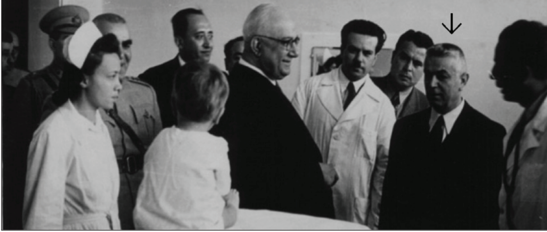
Şekil 2. Dr. Behçet Uz, adını taşıyan hastanenin açılışında Başbakan Recep Peker ile birlikte (2 Nisan 1947) (3).