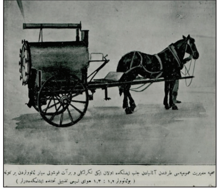
Ek 1. Seyyar etüv makinesi (24).