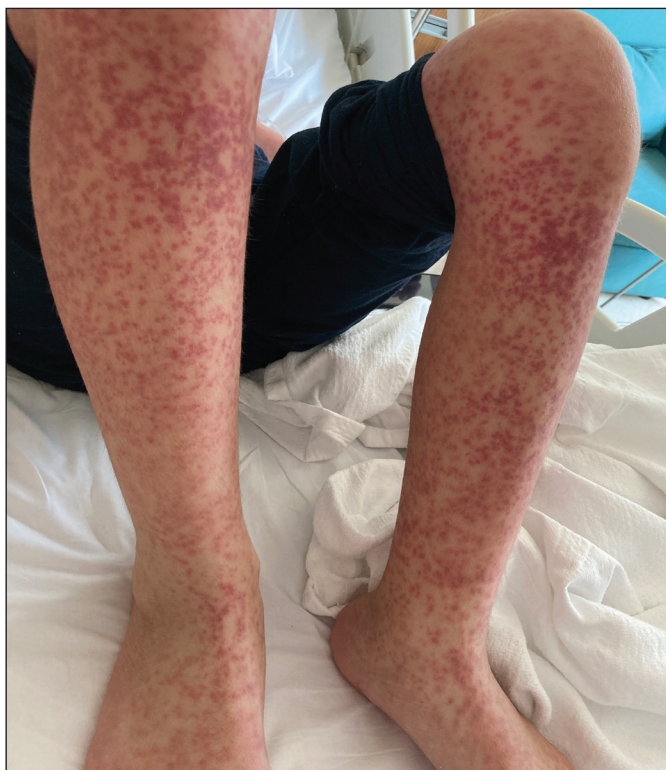
Şekil 1. Bacaklarda yaygın makulopapüler döküntü.

Antibiyotiklerin EBV ile ilişkili enfeksiyöz mononükleozlu hastalarda döküntüye neden olduğu bilinmektedir. Ampisilin ve amoksisilin vakaların %90-100'ünden sorumludur. Bu tür hastalarda antibiyotiklerle ilişkilendirilen döküntü varlığı EBV enfeksiyonları için patognomonik olabilir.