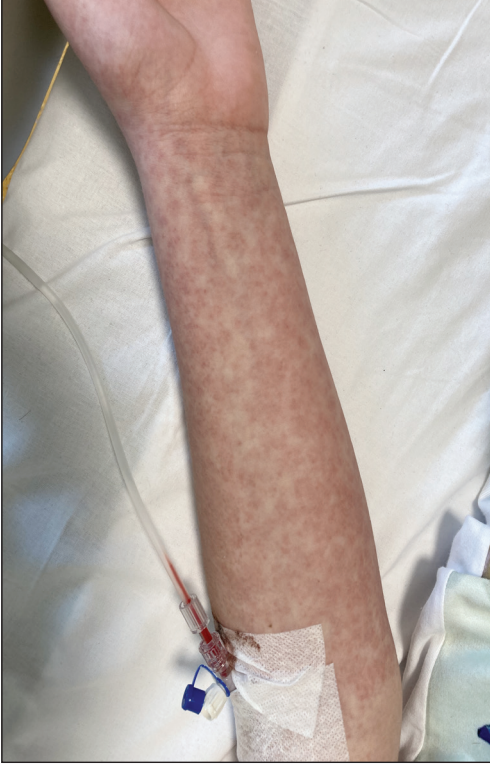
Şekil 2. Kolda yaygın makulopapüler döküntü.