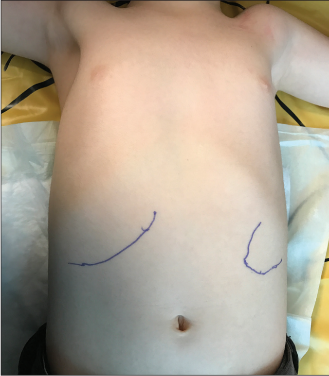
Resim 3. Hepatosplenomegali.